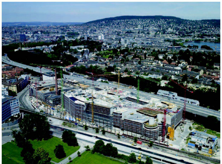
Abb. 2: Sihlcity während des Hochbaus im Sommer 2005. Die Eröffnung des Einkaufs- und Erlebnisentrums erfolgt im Frühling 2007.

den motorisierten Privatverkehr, allfällige denkmalpflegerische Forderungen bei bestehenden Altbauten, die Situation bezüglich Konkurrenzprojekte, das ökonomische Umfeld und die diversen Markt-