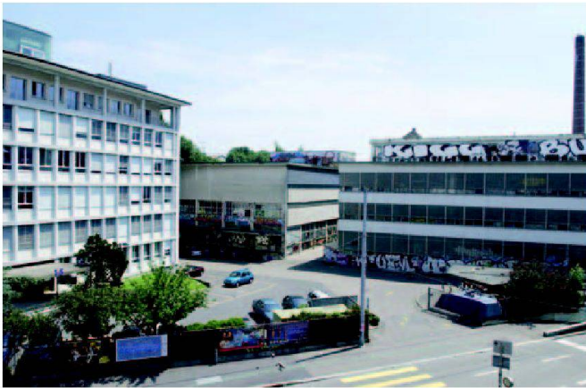
Abb. 3: Denkmalgeschützte Bauten wie das ehemalige Kalandergesellschaft-Gebäude mit der Glasbausteinfassade werden ins Überbauungskonzept von Sihlcity integriert.