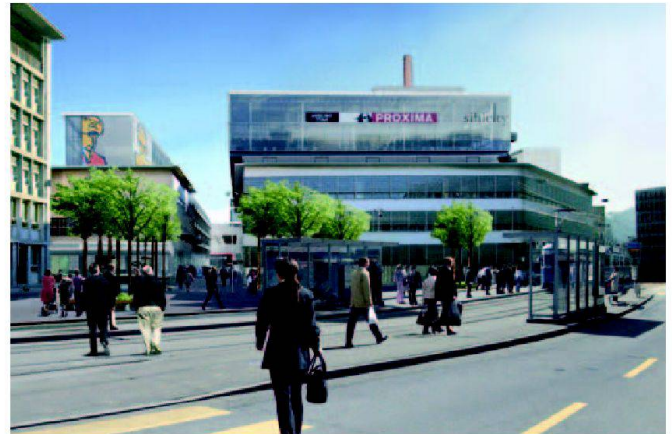
Abb. 4: Mit Sihlcity entsteht ein neuer Stadtteil mit einem vielfältigen Angebot an Produkten und Dienstleistungen (Visualisierung).

und die Nutzungsanordnung für das Bauvorhaben. In der anschliessenden Planungsphase wird das abstrakte Produkt von Architekten und Ingenieuren in ein konkretes Projekt umgesetzt.