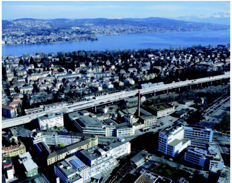
Abb. 1: Luftaufnahme der im Jahre 1977 stillgelegten Sihl Papierfabrik in Zürich-Wiedikon mit dem markanten Hochkamin im Zentrum.

Das Landmanagement bei Industriebrachen ist grundsätzlich mit dem Vorgehen bei einer herkömmlichen Melioration vergleichbar. Am Anfang der Entwicklung steht – im Sinne einer Eignungskartierung – die Standort-, Markt- und Konkurrenzanalyse. Ausgehend von der bestehenden Situation werden unter anderem die Makro- und Mikrolage, die Erschliessung, die Anbindung an den öffentlichen und