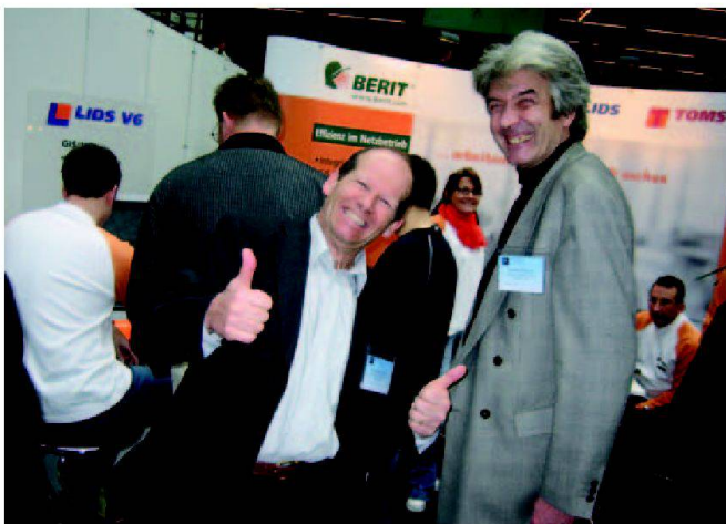
Sichtlich zufriedene BERIT-Kunden.

sichtlich begeistert. Speziell die Durchgängigkeit und Flexibilität der Work-Management-Lösung TOMS wurde von den Besuchern als grosser Vorteil angesehen. Darüber hinaus fanden die komplett überarbeiteten Fachschalen,