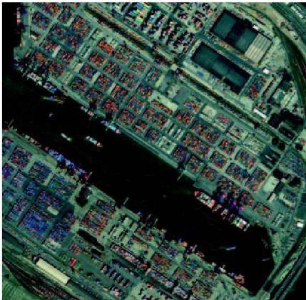
Abb. 3: Warentransport am Hafen Hamburg.