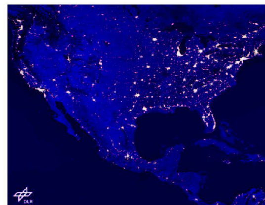
Abb. 2: Bevölkerungsverteilung in den USA.

Medien- und Methodenkompetenz Lernpsychologische Erkenntnisse, gesellschaftliche Veränderungen und Anforderungen der Berufswelt an zukünftige Lehrlinge erfordern, dass bereits Schüler/-innen lernen, sich Informationen zu beschaffen und zu verarbeiten. Zunehmend wird selbständiges Arbeiten verlangt und der Austausch in Gruppen oder Meinungsbildungsprozesse gehören zu selbstverständlichen Berufskompetenzen. Die Aufträge mit den Luft- und Satellitenbildern fördern diese Fähigkeiten. Zusätzlich dazu lernen die Schüler/-innen, eine gegenüber Medien kritische Haltung einzunehmen, in dem sie Bilder deuten, hinterfragen und in Bezug setzen zu eigenen Erkenntnissen. Zudem setzen sie sich verstärkter als bisher mit einem Medium kritisch auseinander und werden fähig, diese Kompetenz auf andere Medien zu übertragen.