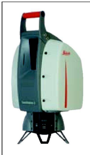
Leica ScanStation 2.

Leica Geosystems hat heute einen weiteren grossen Schritt im Bereich der Puls-Scanner für topographische Geländeaufnahmen und Bestandserfassung angekündigt. Die Leica ScanStation 2, die