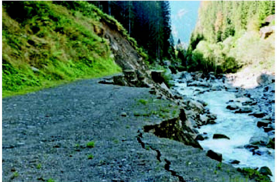
Abb. 1: Das war der Verbindungsweg ins Hintere Maderanertal.

Ein Wiederaufbau des Talweges stand wegen dem hohen Schadenpotenzial durch weitere Hochwasser, Lawinen und Murgänge sowie den hohen Kosten nicht mehr zur Diskussion. Es musste eine neue, sichere Verbindung gefunden werden. Bei