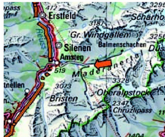
Alpweg Heimchuerüti-Stössi, Maderanertal (Kt. UR).

Das finanzielle Ausmass der Schäden war ausserordentlich hoch und wird gesamtschweizerisch auf rund drei Milliarden Franken beziffert. Am Beispiel des Maderanertals im Kanton Uri wird die Bewältigung der Unwetterschäden genauer betrachtet. Bis vor dem Unwetter vom August 2005 war das Hintere Maderanertal durch die Talstrasse erschlossen. Durch