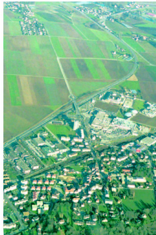
Abb. 1: Zersiedelte und strukturell verarmte Landschaft im schweizerischen Mittelland.

dert hätte. Schon 1955 hatte ein schmales rotes Büchlein mit dem Titel «achtung: die Schweiz» vor einer unkontrolliert wachsenden Stadtlandschaft gewarnt. Die drei Autoren Lucius Burckhard, Max Frisch und Markus Kutter schlugen vor, die Begrenztheit der Fläche als gegebene Herausforderung zu respektieren, die