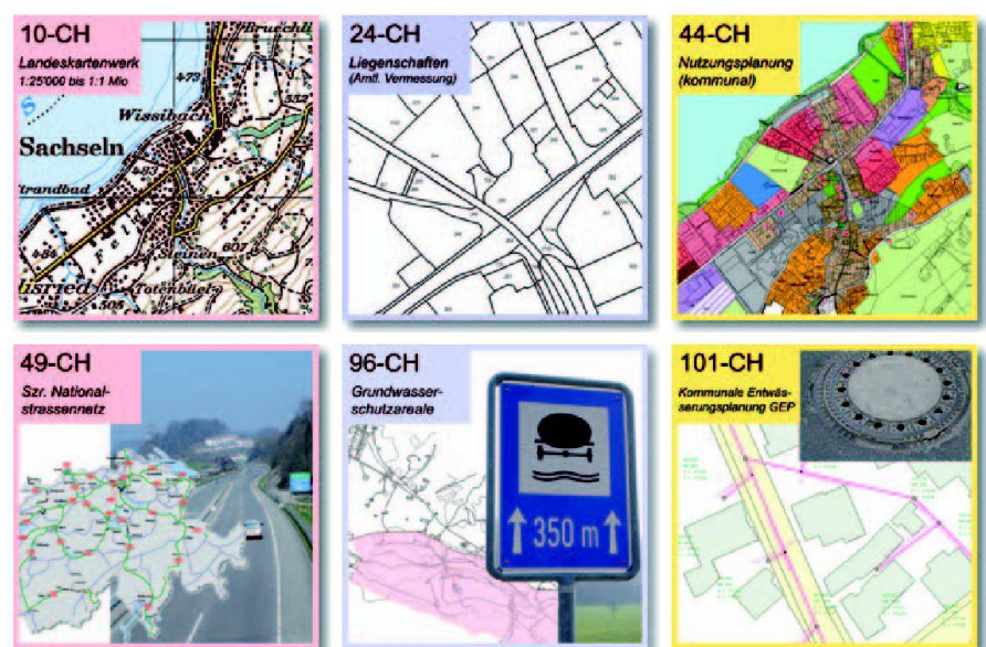
Abb. 2: Ausgewählte Geobasisdaten nach Bundesrecht; links: in Bundeszuständigkeit (Klasse I), mittig: in kantonaler Zuständigkeit (Klasse II), rechts: in Gemeindefähigkeit (Klasse III).