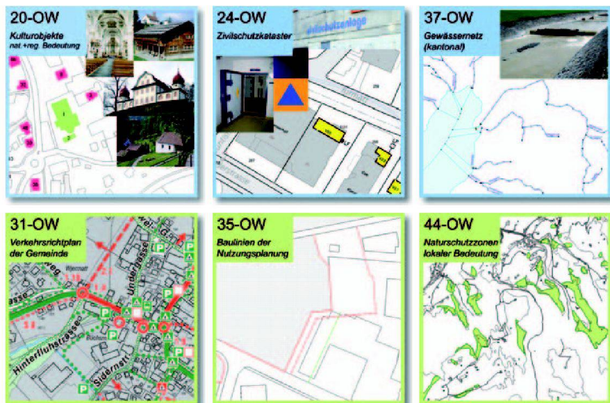
Abb. 3: Ausgewählte Geobasisdaten nach Kantonsrecht Obwalden; obere Reihe: in Kantonszuständigkeit (Klasse IV), untere Reihe: in Gemeindezuständigkeit (Klasse V).