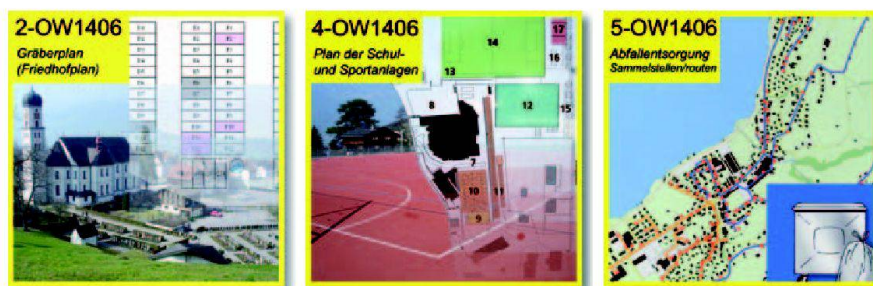
Abb. 4: Ausgewählte Geobasisdaten nach Gemeinderecht (Klasse VI) aus der Gemeinde Sachseln OW (BFS-Nummer 1406).