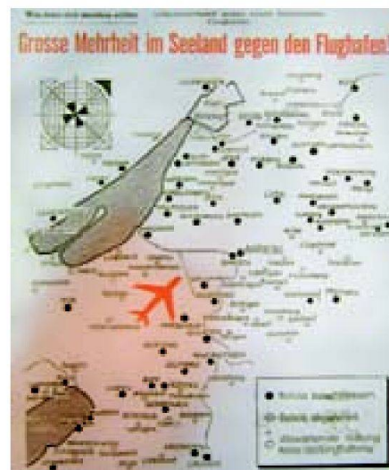
Abb. 7: Schutzverband gegen den Flughafen Grosses Moos.

Ausstellung Vision Seeland: Öffnungszeiten: Mo–Fr 8.00–18.00 Uhr Sa, So 10.00–16.00 Uhr