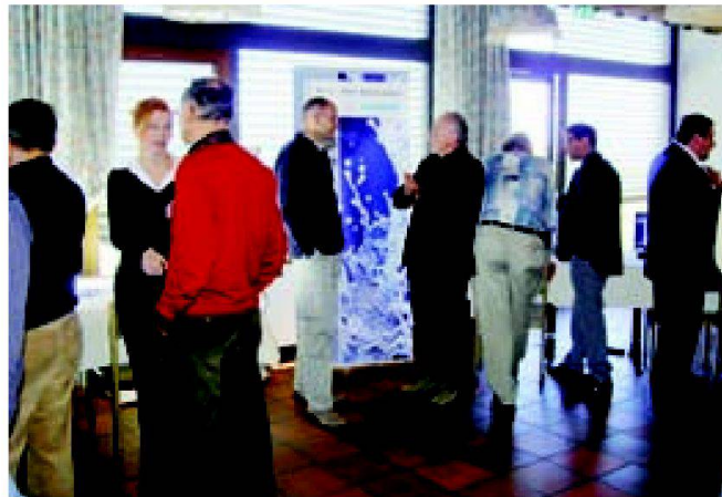
Leistungsschau von Softwareanbietern.

zur Plandarstellung erfasst werden (z.B. Leitungskataster) sondern als Grundlagen für Führungsprozesse, Planungsinstrumente, Unterhalt und Betriebsoptimierung. Das heisst aber auch, dass man bei der Datenerfassung nicht mehr nur in Linien und Punkten denkt, sondern Elemente anfängt als Objekte mit einer Vielfalt an Eigenschaften zu erfassen. Eine Leitung ist dann mehr als eine Linie von Koordinate A nach B sondern ist auch mit einem Schacht oben und unten verknüpft, hat eine Angabe zu Kosten, ein Baujahr etc. Geomatiker mit ihren Stärken und Erfahrungen aus der Vermessung und GIS sind herausgefordert, dieses Wissen mit Fachexperten, die Teile des GEP bearbeiten, zu teilen, und sich von ihnen in die spezifischen Bedürfnisse deren Aufgaben einzudenken, damit die erhobenen Daten am Schluss für alle nutzbar sind. Und wer ein GEP bearbeitet, der sollte in Zukunft wissen, was INTERLIS ist. Das wird gewisse Mehrkosten bei der Ersterfassung verursachen, die aber spätestens dann amortisiert sind, wenn eine