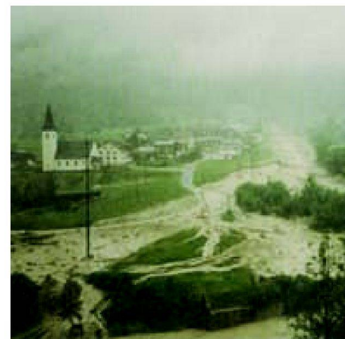
Abb. 4–6: Zignau 1868, 1927, 1987.