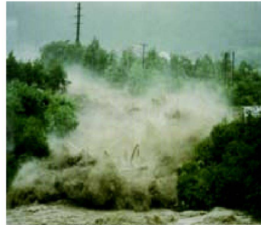
Abb. 3: Zignau (Gemeinde Trun), 18. Juli 1987: Zavrugia-Rüfe (Bilder 3–6 aus: Hundert Jahre Gebäudeversicherung in Graubünden).

Der Einzelne ist nicht in der Lage, sich wirksam gegen Elementarkatastrophen zu schützen. Darum müssen raumplanerische Massnahmen, Flusslauf- und Lawinerverbauungen etc. unter staatlicher Hoheit durchgeführt werden. Auch die Versicherung ist nur im Rahmen vollstän-