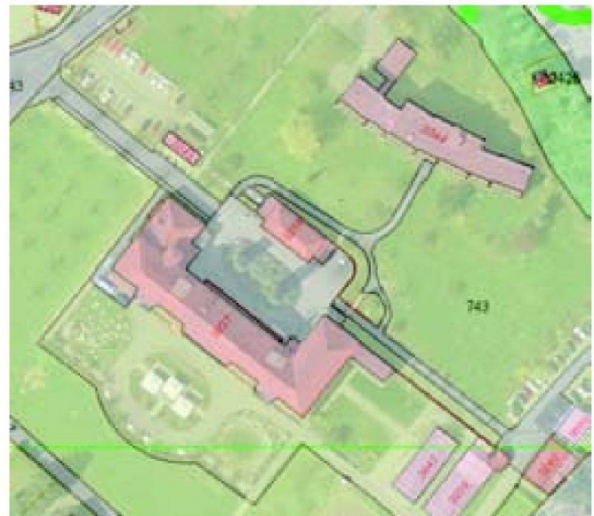
TOPIC Bodenbedeckung mit Orthofoto.