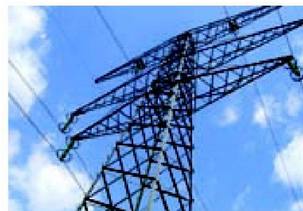
Fig. 2: Les lignes électriques peuvent parfois être une source de courants vagabonds.

Des sources de courants vagabonds en dehors de l'exploitation agricole sont possibles, et peuvent avoir une importance souvent insoupçonnée. Il a déjà été constaté sur des structures d'installations de traite proche de lignes de chemin de