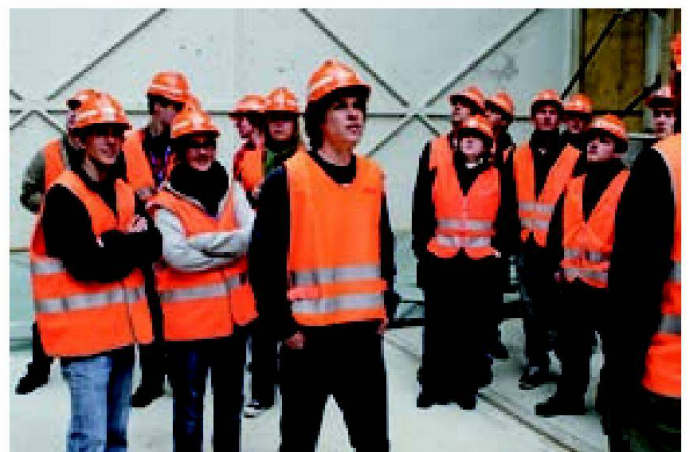
Abb. 2: Eine Gruppe auf der Exkursion Durchmesserlinie.