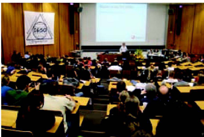
Abb. 1: Präsentationen.

Gönnner: Akademischer Ingenieurverein der ETH Zürich (AIV), Swiss Engineering (Fachgruppe Vermessung und Geoinformation), Red Bull (Schweiz) AG, Starbucks Coffee Switzerland AG, Chocolats Camille Bloch SA, Präsenz Schweiz, Zürich Tourismus, Schweizerische Gesellschaft für Kartografie (SGK), GeoConnexion, Maney Publishing