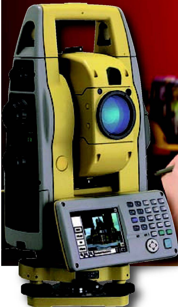
TOPCON IS-2 Imaging Station