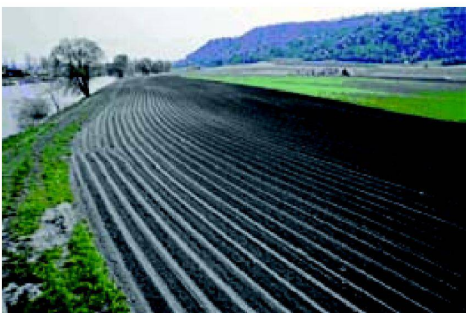
Abb. 5: Die mit Abstand bedeutendste Ursache für erhöhte Nitratkonzentrationen in den Gewässern ist der Acker- und Gemüsebau.