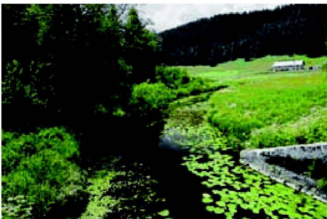
Abb. 3: Fliessgewässer benötigen einen angemessenen Raum und eine standortgerechte Ufervegetation, um ihre ökologischen Funktionen im Naturhaushalt erfüllen zu können.