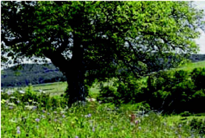
Abb. 1: Biodiversität, die Vielfalt des Lebens, hat im Kulturland seit Mitte des 20. Jahrhunderts stark abgenommen (Bilder aus «Umweltziele Landwirtschaft», BAFU, BWL, Bern 2008).