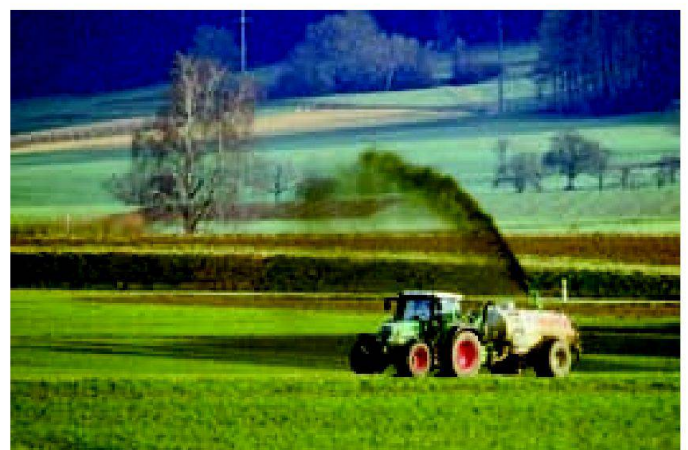
Abb. 6: Ammoniakemissionen aus der Landwirtschaft entstehen beispielsweise während und nach dem Ausbringen von Gülle.