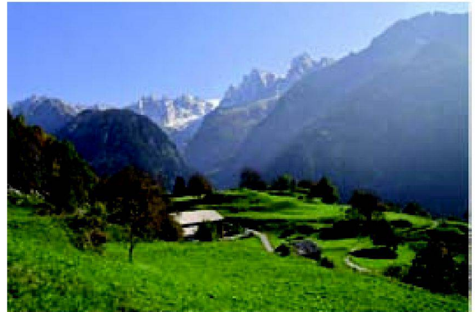
Abb. 2: Die Landwirtschaft trägt eine grosse Verantwortung für die Qualität der Schweizer Landschaften.