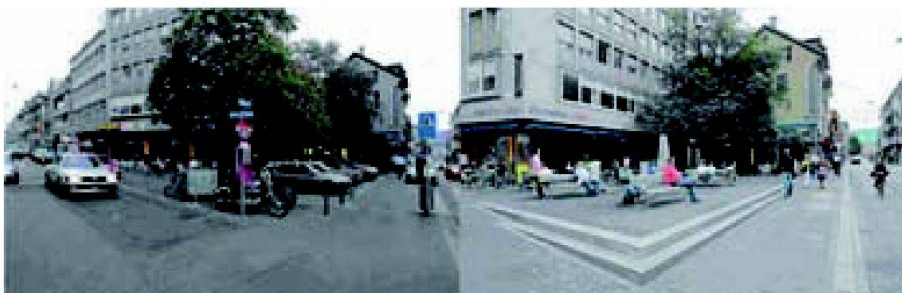
Cella Platz in Zürich (vor und nach der Realisierung 2007), «Stadträume 2010. Eine Strategie zur Gestaltung von Zürichs öffentlichem Raum».

Im Rahmen von zwölf Workshops wurden konkrete Ansätze für die Planung und das Management von öffentlichen Räumen diskutiert. Wichtige Erkenntnisse daraus sind, dass es klare Vorstellungen braucht,