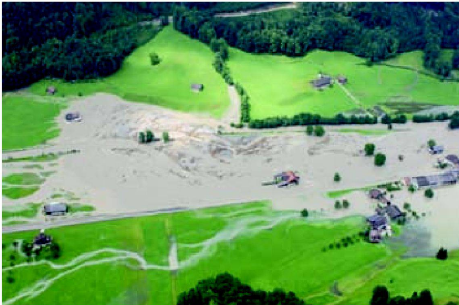
Abb. 1: Verlorenes Land: Engelberger Aa bei Wolfenschiessen.

Bei grossen Flüssen (Sohle > 5 m) ist dies nicht der Fall. Massgebend für die LN sind Art. 14 und 16 der Landwirtschaftlichen Begriffsverordnung LBV 1 . Wegen der Landbeschaffung ist die Landwirtschaft der wichtigste Partner bei Projekten im Zusammenhang mit Naturgefahren.