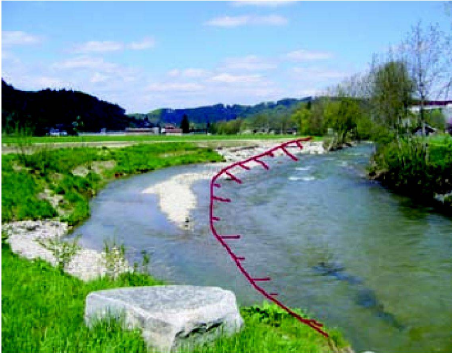
Abb. 3: Landbeschaffung für die Wigger bei Altishofen (Kanton Luzern) mit alter Uferlinie (rot).

dass die Wasserableitung oder Wasserrückhaltung bei einem Überlastfall funktionieren kann. Deshalb braucht es entsprechende vertragliche und grundbuchliche Regelungen. Ein Landerwerb ist dabei nicht unbedingt notwendig. Aber es müssen Entschädigungen für die Nutzungseinschränkungen und allfällige Schäden geregelt sein.