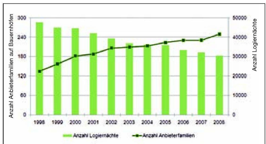
Abb. 3: Schlaf im Stroh.