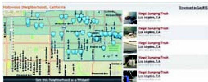
Fig. 1: Abandon de déchets encombrants à Hollywood.

ESRI Suisse SA Route du Cordon 5-7 CH-1260 Nyon Téléphone 022 365 69 00 Téléfax 022 365 69 11 info@nyon.esri.ch www.esri.ch/fr