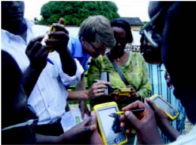
Training der Mitarbeitenden des CNLS, Burundi zur Datenerfassung mit GPS von Trimble.