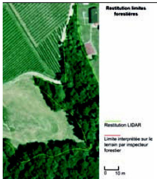
Fig. 4: Représentation des limites forestières sur fond orthophoto.

rapport aux exigences de la mensuration. Les écarts moyens sont de 1.4 m, alors que la tolérance fixe une limite à 1 m. Selon l'interprétation des données, les écarts maximaux (jusqu'à 7 m) sont considérables.