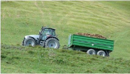
Abb. 7: Auch im Berggebiet haben grosse und schwere Maschinen Einzug gehalten.

der unsensiblen Behandlung des Kulturlandes bei Ortsplanungen, aber auch als Grundlage bei Gesamtmeliorationsprojekten, hat die suissemelio (Schweizerische Vereinigung für ländliche Entwicklung) angeregt, eine Wegleitung zur Landwirtschaftlichen Planung (LP) als Mittel der Wahrung der Interessen der Landwirtschaft auszuarbeiten. Die LP ist für die Beteiligten praxisnah, berührt sie direkt und kann damit zu realisierbaren Projekten führen. Die Wegleitung ist im Jahr 2009 veröffentlicht worden und bereits verschiedentlich in Anwendung.