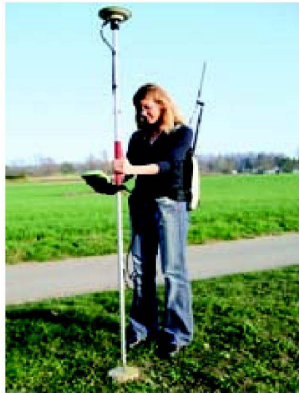
Fig. 2: