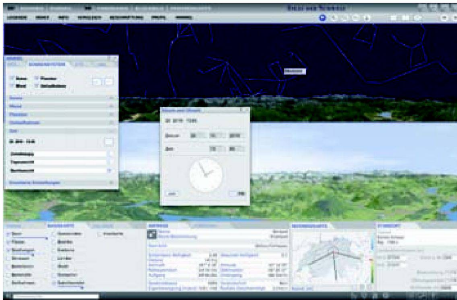
Abb. 2: 3D-Panorama mit Nachthimmel (oben) und Tagesansicht (unten). Fig. 2: Panorama en 3D avec ciel nocturne (en haut) et vue diurne (en bas).

Kommunikation aufgenommen worden, sodass heute ca. 2000 Kartenthemen verfügbar sind. Dann wurden neue Kartendarstellungen wie z.B. Linien- und Netzkarten (Transport, Pendler etc.), Fokuskarten (Flugverkehr) oder statistische 3D-Oberflächen integriert. Und schliesslich wurden neue Tools entwickelt, die es ermöglichen, den Bildschirm für Vergleichszwecke horizontal und vertikal zu teilen, Karten zu beschriften, 3D-Geländeskizzen zu erstellen, GPS-Tracks zu importieren und bei Panoramen den Himmel zu gestalten.