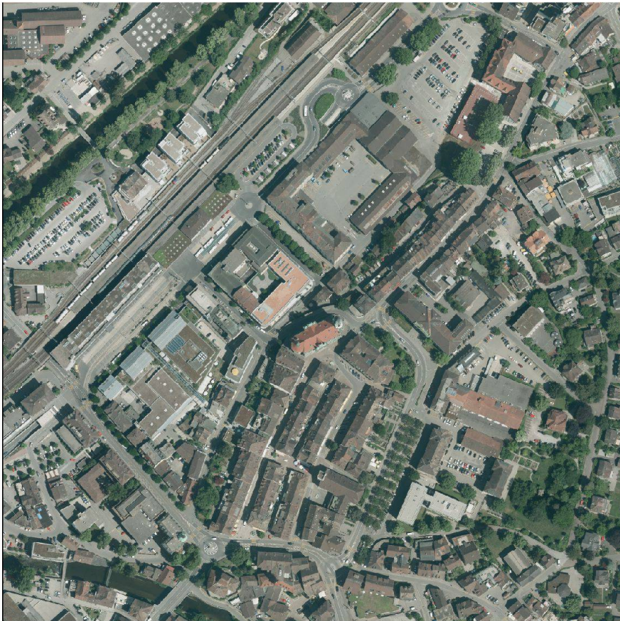
Abb. 5: Orthofoto, Ausschnitt Frauenfeld.