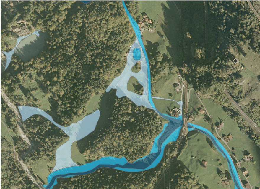
Abb. 2: Ausschnitt der kartierten Überflutungsflächen im Bereich Blausee, Gemeinde Kandergrund (Flotron AG / Emch+Berger AG).