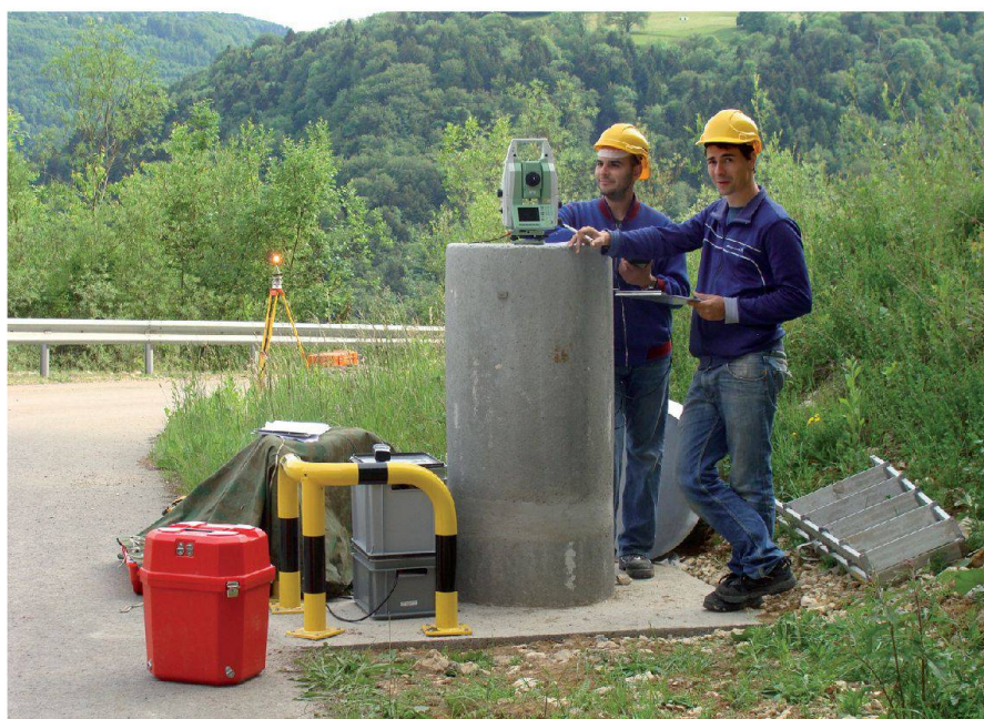
Abb. 2: Felslabor Mont Terri: Projekt Ingenieurgeodäsie G6.

Download des vollständigen Jahresberichts: www.fhnw.ch/habg/ivgi/institut/jahresbericht