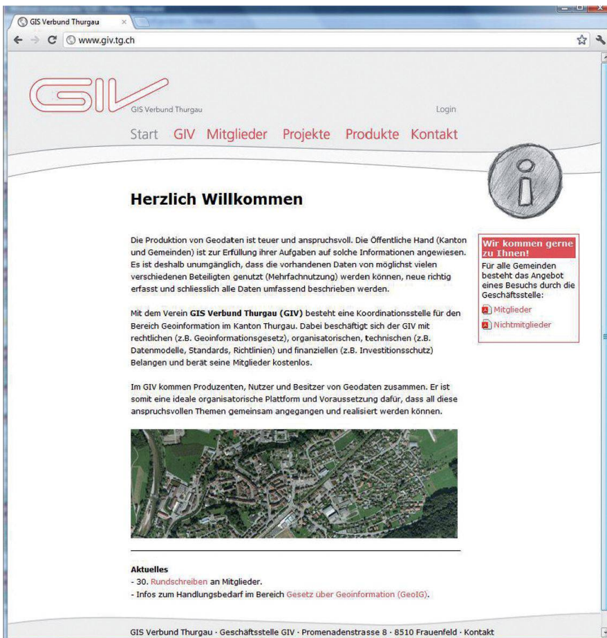
Abb. 2: Die Website des GIV wird rege als Informationskanal zu den Mitgliedern genutzt.

Ziele des GIV und des Kantons als Mitglied sind, dass die über etliche Jahre erarbeiteten Produkte und Dienstleistungen des Vereins (Normen, Standards, Datenmodelle, Arbeitsunterlagen, Checkertools, Veranstaltungen, Beratungen, usw.), die durch die Mitglieder (verschiedenste kantonale Stellen, Gemeinden, Ver-/Entsorger, unterschiedliche Ingenieurfachbereiche) im beruflichen Alltag täglich genutzt werden, wie bis anhin auch in Zukunft durch den Verein fachgerecht und zuverlässig produziert und auch ständig nachgeführt werden. So widmet sich der GIV aktuell der Überar-