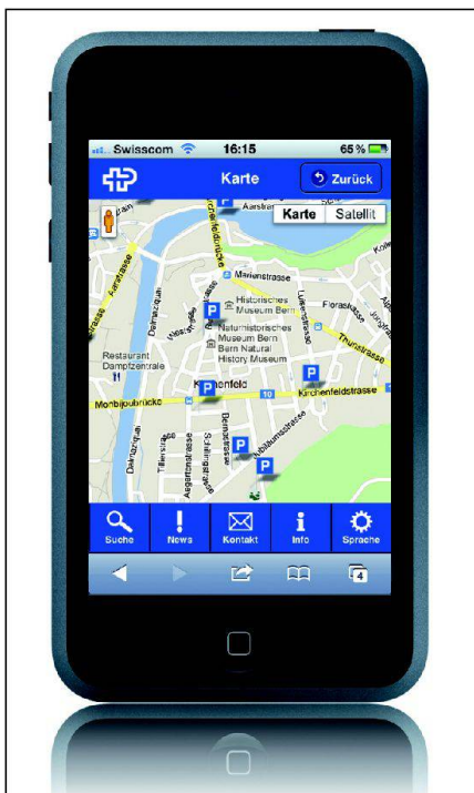
Abb. 3: ParaMap, mobile Applikation mit Rollstuhlparkplätzen.

Seitens der Nutzer der Rollstuhlparkplatzinformationen konnten bereits heute viele positive Reaktionen entgegen genommen werden. Sie freuen sich auf eine baldige schweizweite Flächendeckung. Auch Organisationen im Umfeld von gehbehinderten und querschnittgelähmten Personen begrüssen die Projektinitiative ausserordentlich. Im Weiteren zeigen Navigationssystemhersteller, Behinderten- und Verkehrsinformationsdiensteanbieter ein hohes Interesse an den Daten. Einer weiten Verbreitung von Rollstuhlparkplatzinformationen kann zuversichtlich entgegen geblickt werden. Die Projektorganisation dankt an dieser Stelle allen Beteiligten für ihre Arbeit und für die verschiedenen Unterstützungen.