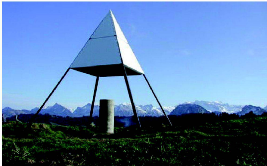
Pyramide auf dem Stöcklichrüz (Quelle: Bundesamt für Landestopografie).

Im Kanton Schwyz steht eine Pyramide auf der Rigi und eine auf dem Stöcklichrüz. Diese Pyramiden sind so genannte Fixpunkte 1. Ordnung. Die Fixpunkte 1. Ordnung bilden mit ihren Koordinaten die Grundlage der amtlichen Vermessung. An zwei Informationstagen im Jahr 2012 wird unter dem Motto «Auch die Schweiz hat Pyramiden!» auf die Pyramide bzw. den Fixpunkt 1. Ordnung auf der Rigi aufmerksam gemacht. Der interessierten Bevölkerung wird die Möglichkeit gegeben, Vermessungsgeräte unter Anleitung einer