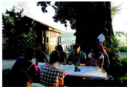
Abb. 2: Impression vom Grillfest am Greifensee.

Wettingen, um dort die LägerBräu zu besichtigen. Im Herbst finden eine Besichtigung der Wasserversorgung Zürich und ein Fach-