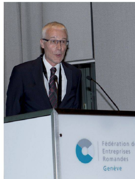
Fig. 2: M. René Leutwyler, Ingénieur cantonal du Canton de Genève.

Les participants à l'assemblée, ainsi que les invités, se sont vus remettre un pin's de l'IGS qu'ils pourront désormais porter en tant que signe distinctif. L'assemblée générale a également traité la problématique des conséquences du droit international sur la mensuration officielle, en particulier la reconnaissance d'un candidat étranger en tant que