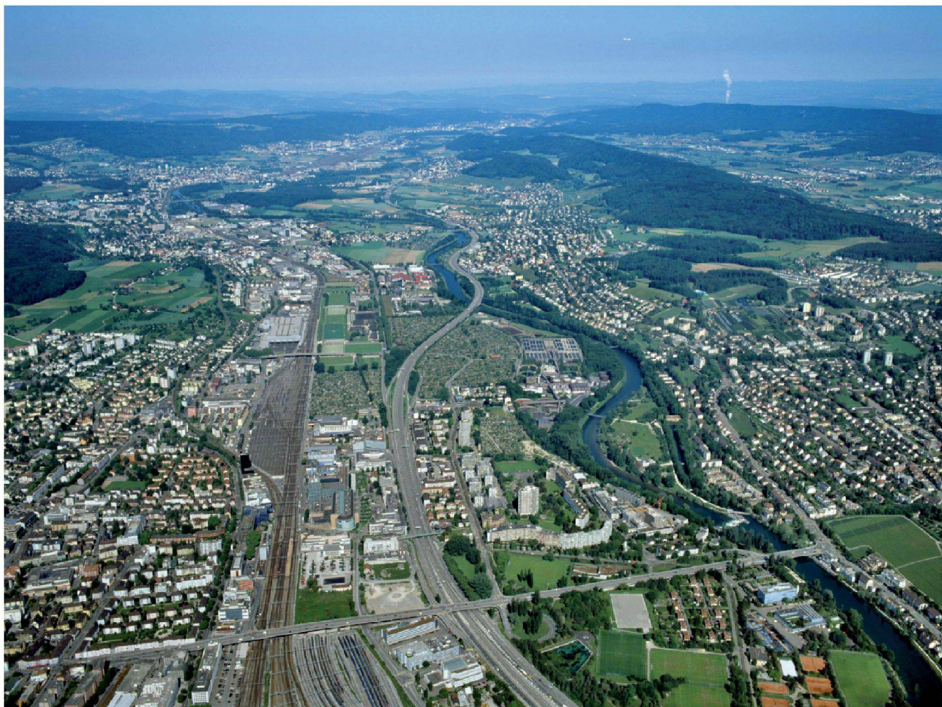
Abb. 2: Blick ins Limmattal, einem Raum von nationaler Bedeutung.

schätzung und Überprüfung raumbedeutsamer Entwicklungen neuartige Werkzeuge für experimentelle Simulationen wichtig.