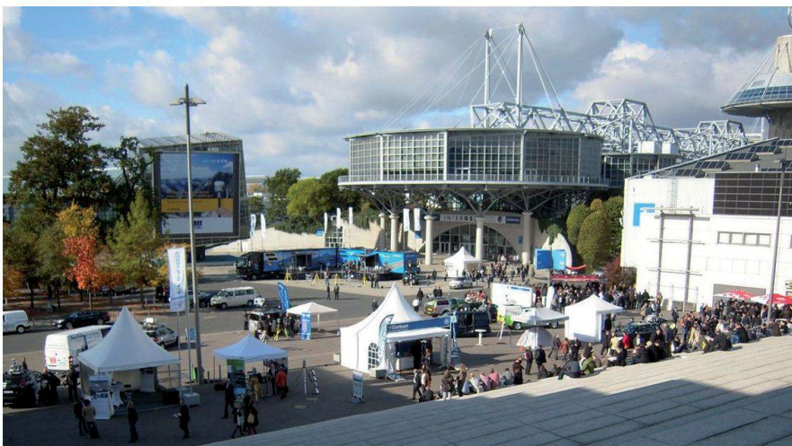
Abb. 3: Die Aussenaussteller, dahinter das Kongresszentrum.