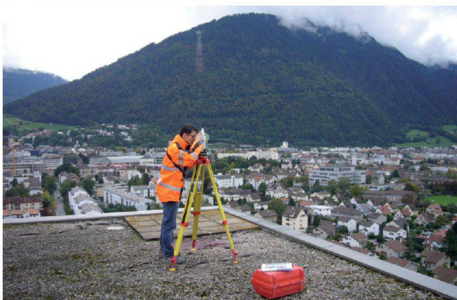
Vermessungen von Mobilfunkanlagen auf den Dächern von Chur (oben), Vermessung über der Altstadt von Chur (unten).