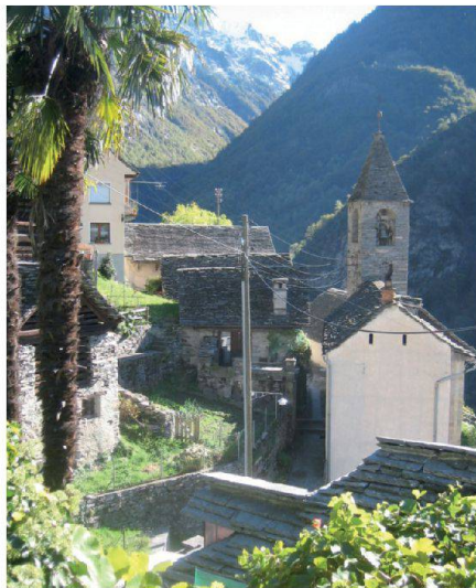
Abb. 1: Brontallo-Kirche.

Erstmals konnten alle Teilnehmer im gleichen Hotel untergebracht werden, sofern sie nicht eine eigene Wohnung hatten. Wie üblich starteten wir mit einem guten Mittagessen, bevor wir mit der FART nach Verscio fuhren. Nach einem kurzen Spaziergang durch das ursprünglich gebliebene Ortszentrum waren wir im Teatro Dimitri angekommen. Mascia Dimitri, die Tochter des berühmten Clowns, führte uns in zwei Gruppen durch das kleine, im August 2000 eröffnete Museum. Die Einrichtung be-