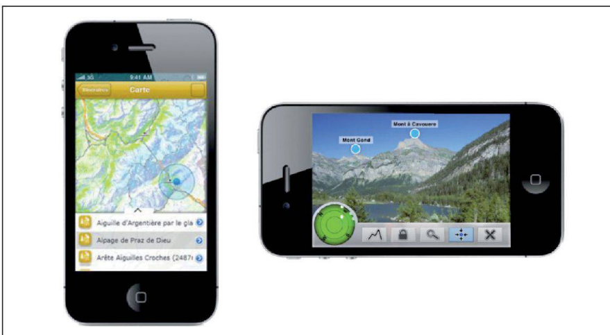
Fig. 2: Application iPhone.