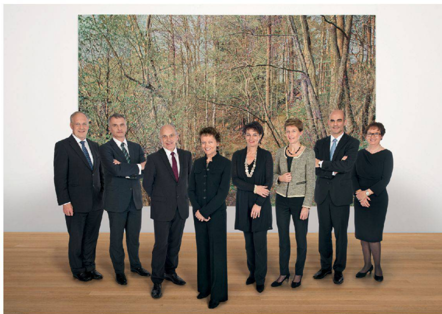
Abb. 2: Der Bundesrat steht zum Wald. Bundesratsfoto 2012.

Bezüglich Begrenzung des Waldeinwuchses reicht eine waldrechtliche Regelung allein nicht aus. Notwendig ist eine integrale Betrachtung, die auch die Raumplanung und die Landwirtschaftspolitik einbezieht. Das heisst, die laufenden Rechtsetzungsarbeiten in diesen Bereichen wie die beiden Teilrevisionen des Raumplanungsgesetzes und die Agrarpolitik 2014–2017 sind mit den Änderungen des Waldgesetzes auf geeignete Art