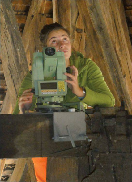
Abb. 4: Bei der Arbeit mit der Balkenklemme.

wonnen werden. Täglich wurde man mit neuen Herausforderungen konfrontiert, so zum Beispiel instabilen Böden, Holzbalken in luftiger Höhe, Sichtbehinderungen oder beengenden Platzverhältnissen. So waren auf dem Turm und Dachstuhl einige Kletterpartien nötig oder es mussten einige Dachziegel entfernt werden um wieder freie Sicht zu den Festpunkten zu erhalten. Mit Balkenklemmen wurde das Tachymeter teilweise direkt an Holzbalken befestigt, so entstanden auch unkonventionelle Stationierungen (Abb. 4). Die Personen und das Instrumentarium wurden jedoch wenn nötig stets gesichert.