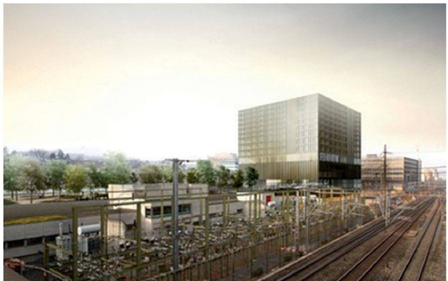
Abb. 2: Kubuk – Domizil des IVGI ab 2018 (© poolarchitekten).

SAP, Deckungsbeiträge, Einhalten von Budgetvorgaben und Leistungsvereinbarungen, Personalentwicklung und Qualitätsmanagement, PR & Marketing sind mittlerweile genauso zentrale Elemente unserer täglichen Arbeit wie ein qualitativ guter Unterricht und die angestrebten