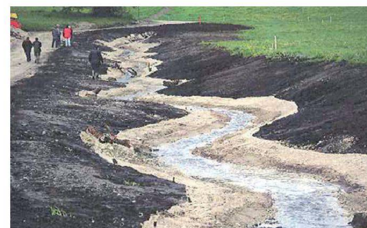
Abb. 7: Limpach im Thuner Westamt, 2004. Künftig dürfte dieser Gewässerraum aufgrund des revidierten GSchG bereits zu wenig breit sein.

Auffallend dabei: Mit der Einführung der EDV hat nebst der Papierflut die Zahl der Mitberichte und Stellungnahmen inflationär zugenommen. Was einst bei grossen Projekten durchaus angemessen war, der Einbezug verschiedenster Interessen und Meinungen und deren Abwägung, wird heute fast bei jedem noch so kleinen Projekt geradezu zelebriert. Ich meine dabei nicht nur jene, welche sich zu unse-