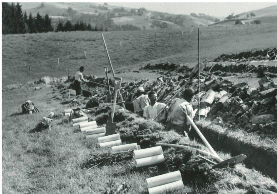
Abb. 2: Rüeggisberg 1944. Aushub der Drainagegräben von Hand 2 .

den war der Bau von einfachen Feldwegen und von Entwässerungen.