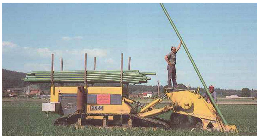
Abb. 3: «Einmann-Maschine» der Firma Zmoos.

Gesamtmeliorationen per se stehen im Kanton Bern zur Zeit weniger im Vordergrund. Umso mehr sind werkbedingte Landumlegungen in Angriff genommen