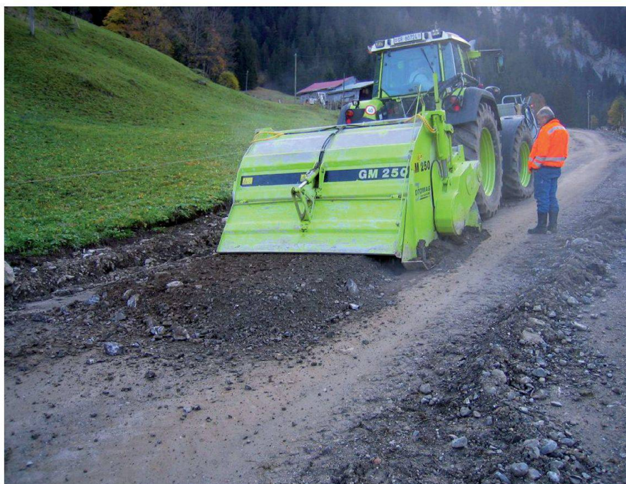
Abb. 9: Mobiler Brecher. Weg Wintergütli, Gsteig, fahrbarer Brecher mit Mischgerät zur Hydrophobierung, 2004.