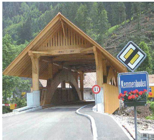
Abb. 4: Gedeckte Holzbrücke über die Emme, hinüber zum Kemmeribodenbad, Schangnau, 2009.

worden: Die restlichen autobahnbedingten Unternehmen entlang der Transjurane, die Landumlegung für den Bau der T-10 als schnelle Verbindung nach Neuenburg sowie die bahnbedingten Landumlegungen für die Neubaustrecke Mattstetten-Rothrist der Bahn 2000. In Vorbereitung sind wasserbaubedingte Landumlegungen.