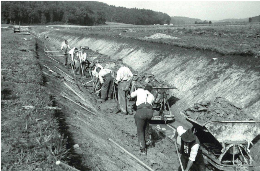
Abb. 6: Kanalbau Altache, Bleienbach, 1943. Aushub ohne Bagger durch Abgraben von Hand und Schaufelwurf direkt in die Kippwagen.

Landkäufe v.a. in Afrika durch fremde Staaten, • der aktuellen Diskussion über Kulturland, Fruchtfolgeflächen, Bodenschutz auch in der Schweiz (die im Kanton Zürich kürzlich angenommene Kulturland-Initiative hat ein Zeichen gesetzt und wird Nachahmung provozieren), • des kürzlich revidierten Gewässerschutz-Gesetzes (GSchG), das die Ausscheidung von Gewässerräumen und Revitalisierungen verlangt, • der Erkenntnis, dass ohne Erschliessungen die Aufgabe von Grenzertragsflächen im Berg- und im Sömmerungsgebiet fortschreitet, was zu monotoner Verbuschung führt und der angestrebten Förderung der Biodiversität abträglich ist, bin ich überzeugt, dass das Meliorationswesen Bestand haben wird. Allerdings werden auch neue Methoden und Instrumente eingeführt und zur Selbstverständlichkeit werden: • Die landwirtschaftliche Planung ist zu fördern als Instrument, mit dem sich die Landwirtschaft – nicht die einzelnen Landwirte – mit ihren Anliegen einbringen kann, wo immer grössere Planungen und Projekte in Vorbereitung sind. Daraus werden integrale Bodenverbesserungsprojekte resultieren.