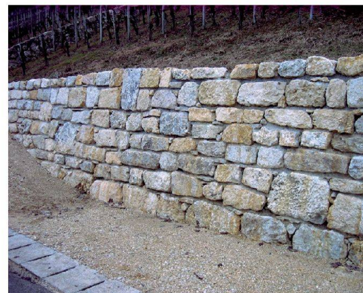
Abb. 5: Rebgrüterzusammenlegung Twann-Ligerz-Tüscherz-Alfermé. Der nach langen Diskussionen gefundene Kompromiss für den Mauerbau Typ Twann: unregelmässig grosse Steine auf Mörtel gebettet, Vertikalfugen Mörtel-frei.