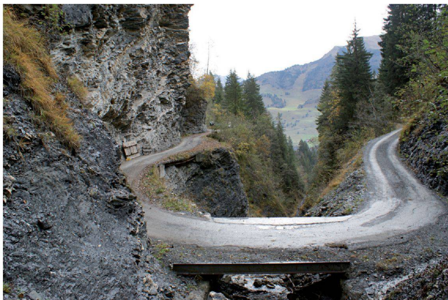
Abb. 3: Querung Gempelegrabe; Zustand bis Frühjahr 2010.