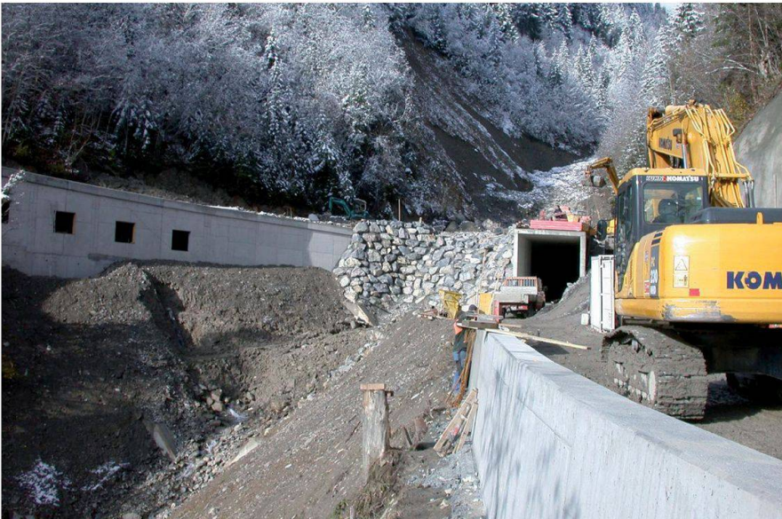
Abb. 4: 1. Etappe: Galerie Zwüschebächgrabe im Rohbau, Oktober 2009. Fig. 4: 1. étape: gros-œuvre de la galerie du Zwüschebächgrabe en cours de construction, octobre 2009.

anschlages abgeschlossen werden können. Hingegen drohen in der 2. Etappe Mehrkosten in der Höhe von mehreren hunderttausend Franken: Auf Grund einer Neu beurteilung der Risikolage musste auf Anordnung des kantonalen Wasserbauingenieurs für die Dauer der Bauphase aus Hochwasserschutzgründen