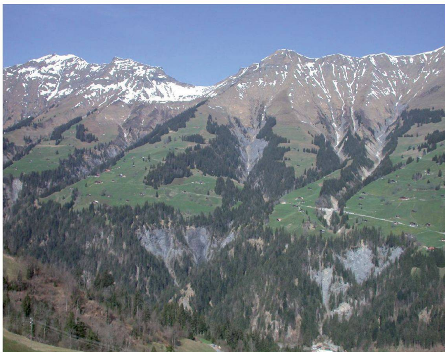
Abb. 1: Spissen Gempele, Zwüschebäch und rechts Ried/Lee. Fig. 1: Les «Spissen» de Gempele, Zwüschebäch et, à droite, Ried/Lee.

breiten Anfahrtsweg erschlossen ist. Ab dem Ortsteil Ried/Lee geht es in südlicher Richtung weiter über den so genannten «Spissenweg», einem alten ehemaligen Karrweg, welcher nach und nach im Laufe der letzten Jahrzehnte notdürftig auf eine Breite von 2.20 Meter ausgebaut wurde. Der als Wanderweg markierte Kiesweg genügt jedoch bezüglich Sicherheit und Ausbaustandard den heutigen Anforderungen der Anwohner bei Weitem nicht mehr. Er durchquert ausgangs Ried bis nach Gempelen den Zwüschebächgrabe, den Ratelsgrabe und den Gempelegrabe. Es handelt sich dabei alles um Wildbachgräben mit grossen Einzugsgebieten, welche jeweils bis hinauf zum Grat der Niesenkette führen. Daher besteht in allen drei Gräben während den Wintermonaten eine latente Lawinengefahr, so dass unter Umständen die Wegverbindung über Wochen gesperrt sein kann. Im Sommer, bei Gewittern und Unwettern, gefährden Murgänge und Geröll die Wegverbindung und deren Benützer. Wegen des sehr witterungsanfälligen Schiefergesteins (Niesenflysch) an den Felswänden entlang des Weges besteht zudem eine permanente Stein-