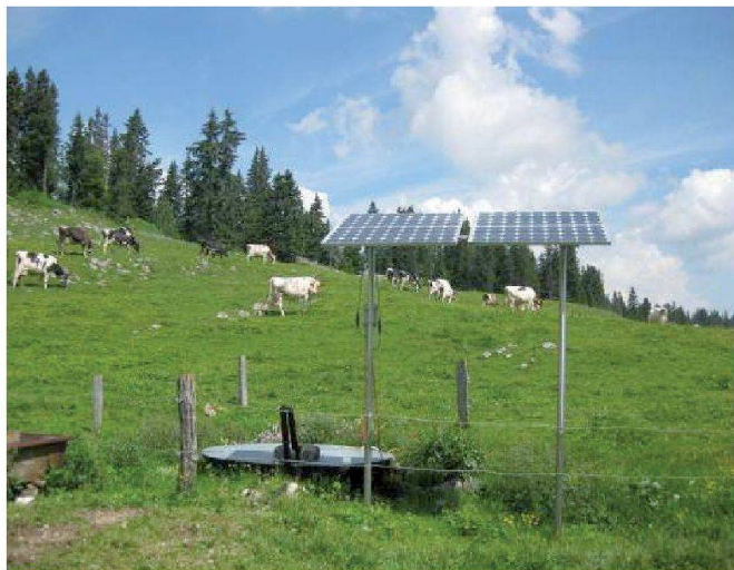
Fig. 8: Panneaux solaires activant une pompe immergée.