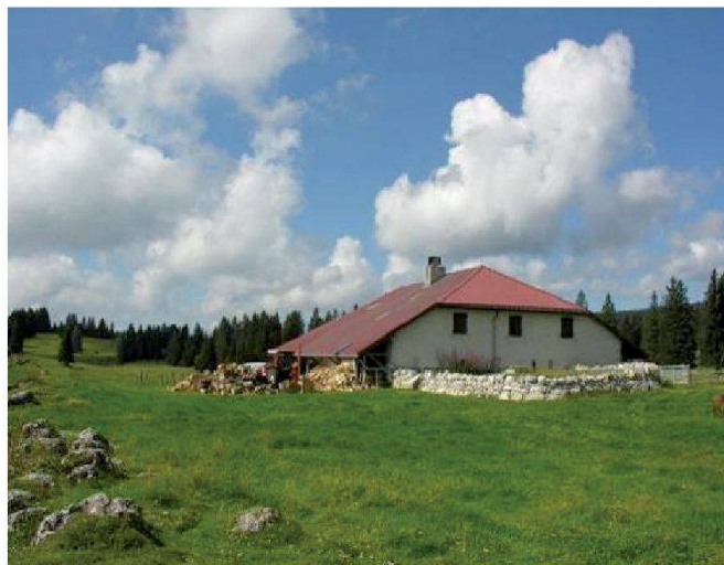
Fig. 9: Citerne alimentée par une toiture.