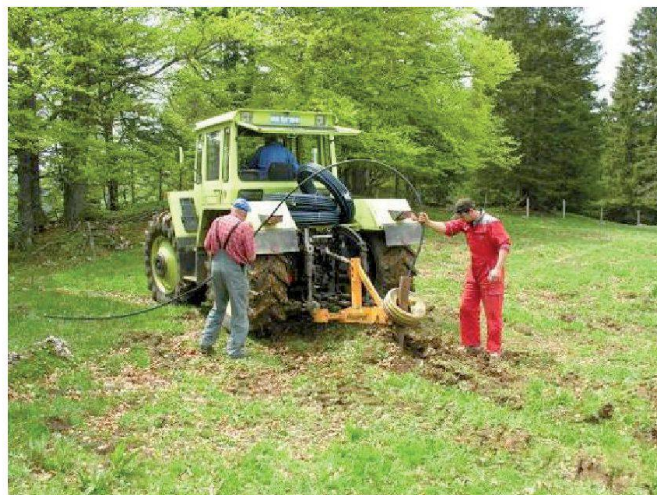
Fig. 7: Pose de conduites à la soussoleuse.