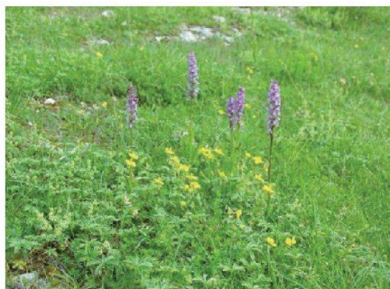
Fig. 11: Pâturage sec riche en orchidées.

tème de pâture et de la maîtrise du rajeunissement du bois et des coupes régulières.