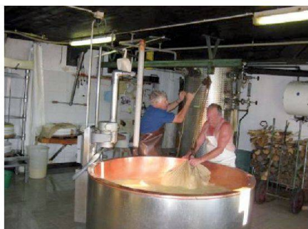
Fig. 4: Fromagerie d'alpage.