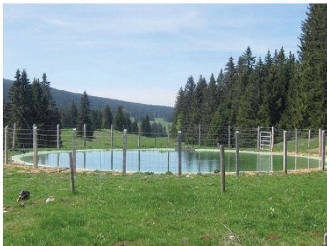
Fig. 6: Etang bâché de 270 m 3 .

La gestion des herbages et des boisés occupe une place importante dans un PGI. Une carte de végétation permet de calculer le potentiel fourrager et le volume de bois sur pied. La pérennité des rendements en herbe et en bois dépend du sys-