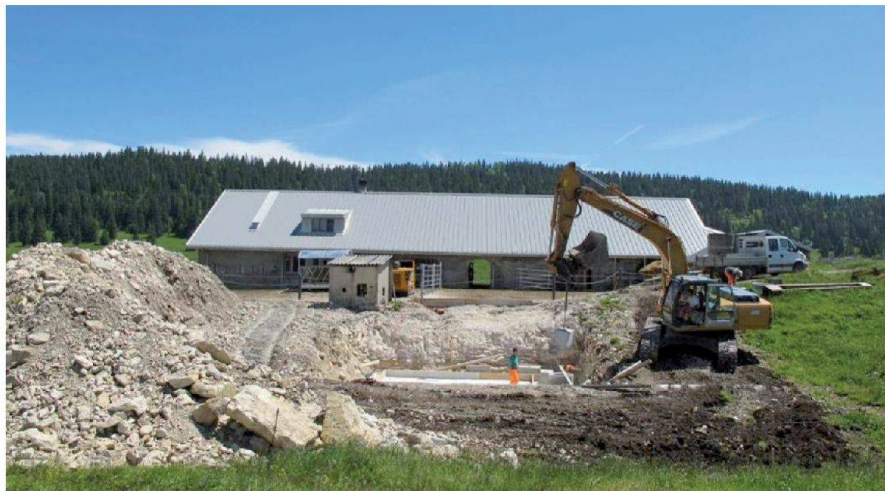
Fig. 3: Réfection d'un chalet: toiture, logement, fromagerie, local d'accueil du public, salle de traite et fosse à purin.