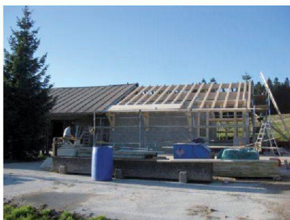
Fig. 5: Construction d'une nouvelle fromagerie d'alpage.

météoriques est également prioritaire. Le respect des particularités architecturales des bâtiments permet de conserver leur typicité.