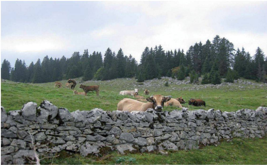
Fig. 1: Boisés, herbages, bétail et mur en pierres sèches sont les caractéristiques principales des alpages jurassiens.