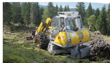
Fig. 12: Nettoyage des branches après une coupe sur pâturage.

La plupart des projets d'aménagement bénéficie de contributions publiques. Les autorités qui allouent des fonds publics