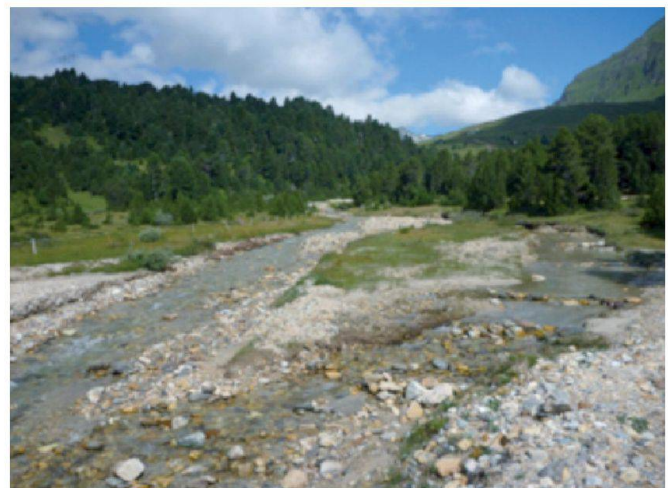
Brenno bei Blenio (TI): Steiles, mittleres Fliessgewässer der alpinen, karbonatischen Alpensüdflanke (Foto: A. Conelli, Oikos).