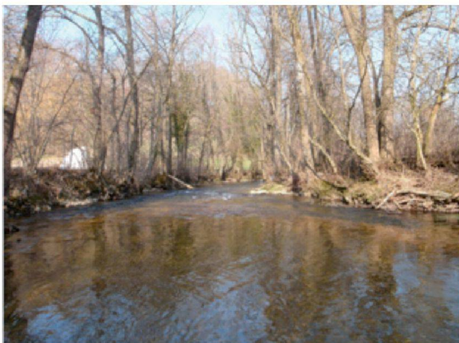
Sorne bei Courfaivre (JU): Mittelsteiles, grosses Fliessgewässer des kollinen, karbonatischen Juras.