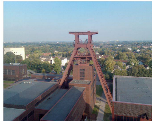
Abb. 2: Auf dem Dach des Ruhrmuseums, das in der ehemaligen Kohlenwäsche (Kokserei) die Natur- und Kulturgeschichte der Region beherbergt, geht der Blick auf den heute stillgelegten Fördererturm der «Zeche Zollverein Schacht XII» sowie weit in die Landschaft des Ruhrgebietes, das sich als grüne Erholungslandschaft präsentiert.

Wiederum ein bedeutender Kongressblock befasste sich mit der Energiewende und dem Beitrag, den unser Beruf zum Gelingen dieses Unterfangens beitragen kann. Dass Geoinformation in diesem Zusammenhang eine ausserordentlich bedeutende Rolle spielt, scheint allen klar zu sein. So ist der Solarpotenzial-Kataster hoch im Kurs. Wichtig sind aber auch Verfahren, die angeboten werden können. Der Anpassung der Verfahren der Flurbereinigung