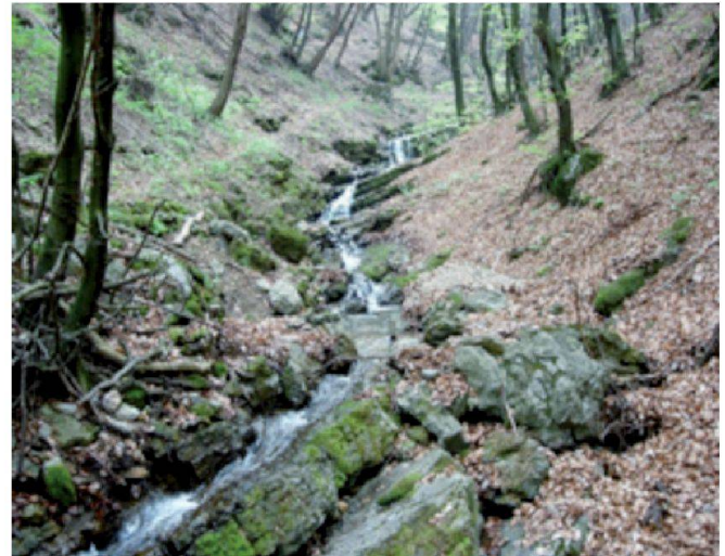
Poma Cragno bei Mendrisio (TI): Steiles, kleines Fliessgewässer der montanen, karbonatischen Alpensüdflanke (Foto: H. Vicentini, Aquabug-CSCF).