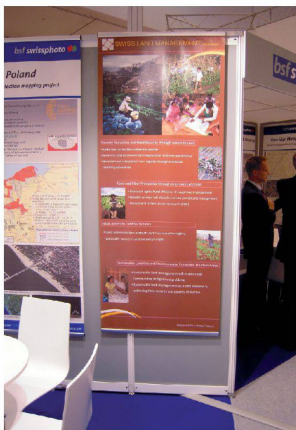
Abb. 1: Swiss Landmanagement (SLM) prominent ausgestellt im Stand der bsf.

Der Präsident des DVW, Prof. Dr.-Ing. Karl-Friedrich Thöne, bezeichnete die Energiewende als wohl wichtigstes politisches Vorhaben