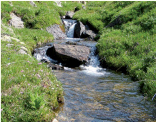
Oxefeldbach im Binntal (VS): Steiles, kleines Fliessgewässer der alpinen, karbonatischen Zentralalpen (Foto: P. Stucki, Aquabug-CSCF).

Monika Schaffner, Abt. Wasser BAFU monika.schaffner@bafu.admin.ch