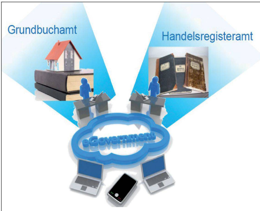
Abb. 1: E-Government in der Justiz-, Gemeinde- und Kirchendirektion des Kantons Bern.

käufer zum Notar – nennen wir ihn Notar Siegel. Für die Errichtung seiner Urkunde benötigt Notar Siegel nebst den Personalien der Vertragsparteien eine Vielzahl von Informationen aus dem Grundbuch. Im besten Fall kann Notar Siegel die für seine Urkunde notwendigen Angaben aus dem Grundbuch elektronisch abfragen und in die Urkunde kopieren. Wenn nicht, bleibt ihm nichts anderes übrig, als alles abzutippen. Reicht der Notar seine Urkunde schliesslich beim zuständigen Grundbuchamt zur Anmeldung im Grundbuch ein, muss dieses wiederum die meisten Daten aus der Urkunde im elektronischen Grundbuch eingeben. Oder etwas salopp ausgedrückt werden heute für die Abwicklung von Grundbuchgeschäften eine Vielzahl von Informationen in ein elektronisches System getippt und auf Papier ausgedruckt, nur damit dieselben Informationen beim nächsten Verarbeitungsschritt wiederum in ein elektronisches System eingegeben werden müssen. Das kann doch nicht mehr zeitgemäss sein!