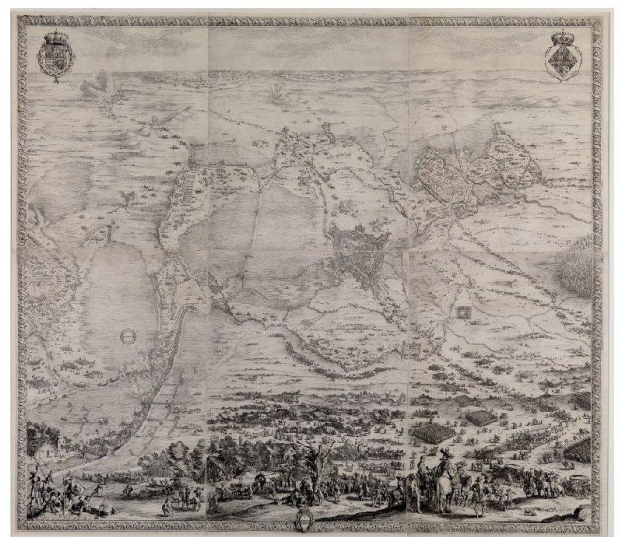
Jacques Callot, Landkarte aus der Vogelperspektive von der Belagerung von Breda 1624–1625 (um 1627), Kupferstich, 125,5 x 147 cm, Staatliche Kunsthalle Karlsruhe.