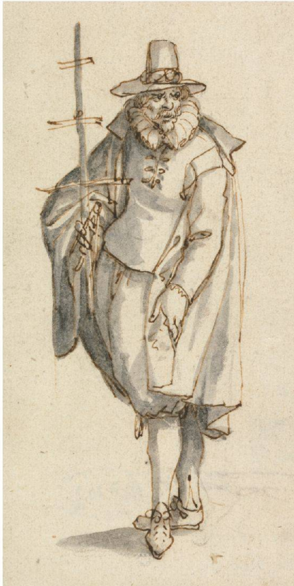
David Vinckboons, Ein Geograf (ohne Jahr), Federzeichnung, 17,4 x 10,3 cm, Königliche Kunstmuseen Belgiens, Brüssel.

Das ZKM Museum für Neue Kunst Karlsruhe wirft einen neuen Blick auf die Landschaftsmalerei des 17. Jahrhunderts. Vergleichbar der modernen Satellitenvermessung (GPS) verdankt sich auch die massstäbliche Landschaftsaufnahme einem verzweigten Netzwerk des Wissens: der Allianz von Geodäten, Mathematikern, Instrumentenbauern und Malern. Lange bevor die Neuen Medien sich also digitaler Bilder aus dem All bedienen, entwarfen Künstler moderne Fernerkundungssysteme.