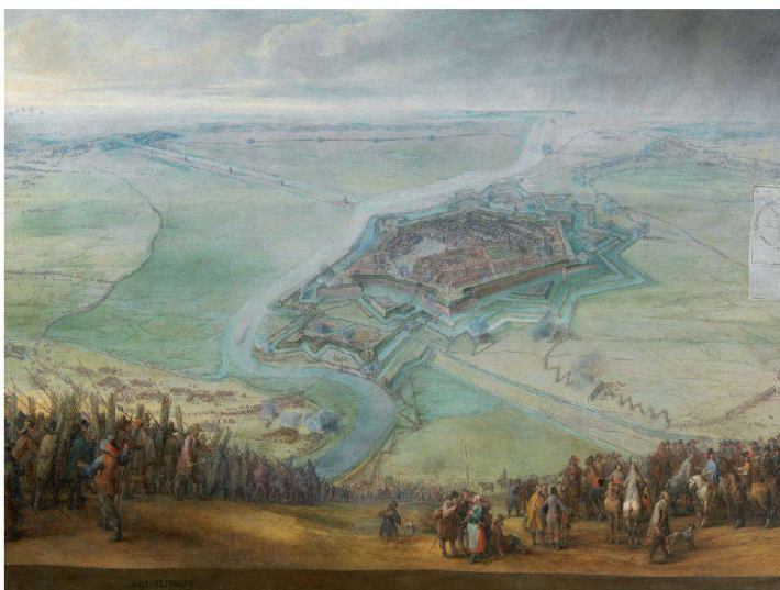
Pieter Snayers, Die Belagerung von Gravelines vom 11. April bis 17. Mai 1652 (um 1653), Öl auf Leinwand, 188 x 260 cm, Photographic Archive, Museo Nacional del Prado, Madrid.