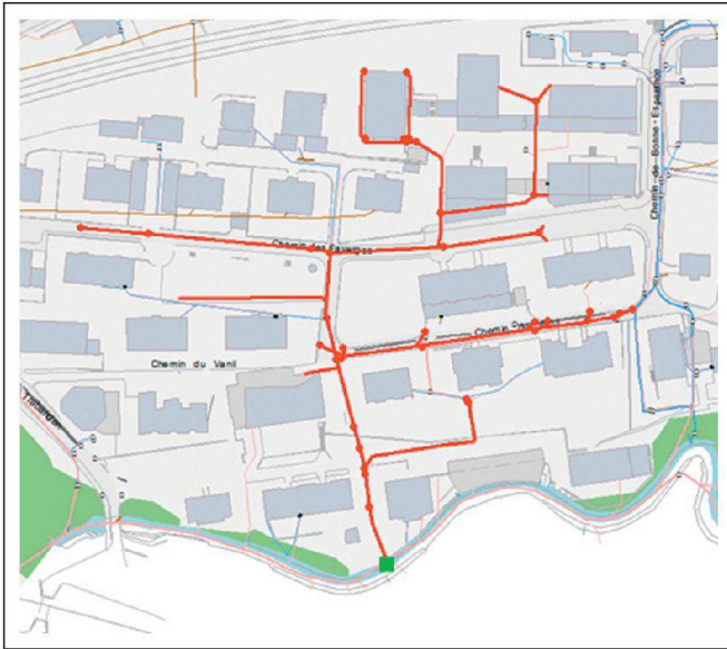
Fig. 7: Percorso dei flussi a monte di uno scarico. Abb. 7: Fließstrecke der Ströme oberhalb eines Ausflusses EC. Fig. 7: Parcours des flux en amont d'un exutoire EC.