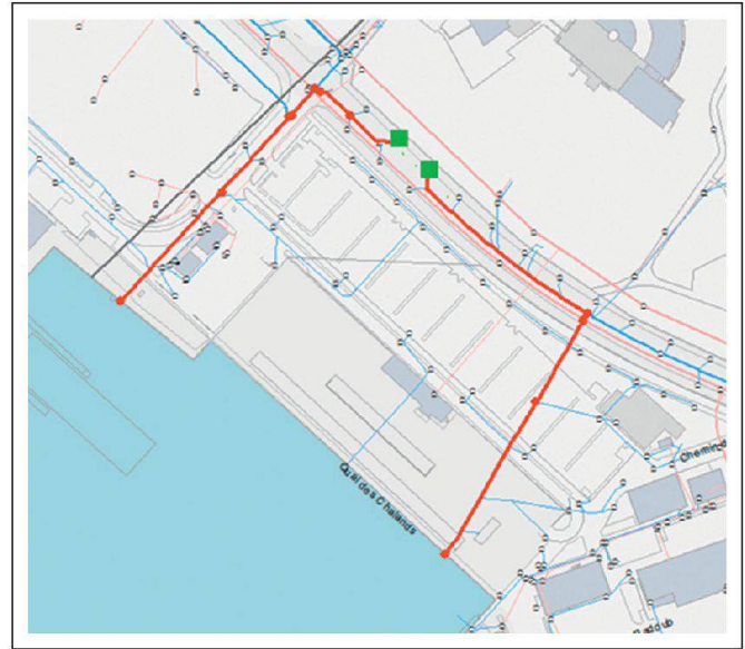
Fig. 8: Percorso a valle di due pozzetti di raccolta. Abb. 8: Fließstrecke der Ströme unterhalb von zwei Einlaufschächten. Fig. 8: Parcours des flux en aval de deux grilles.