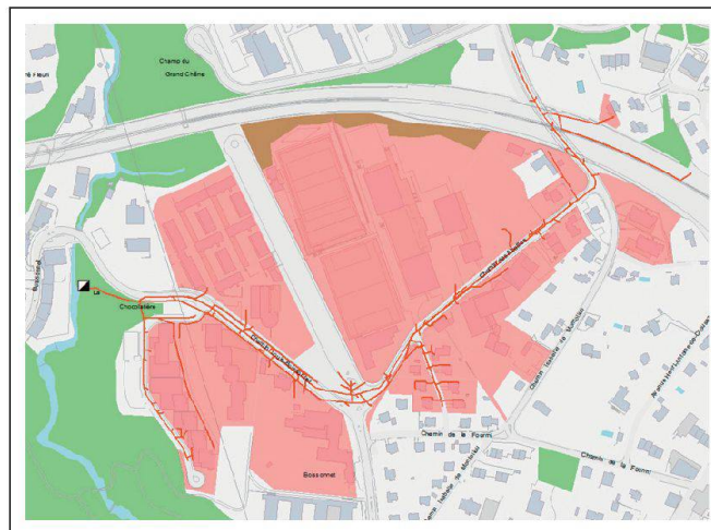
Fig. 12: Generare bacini idrografici. Abb. 12: Erstellen der Abwasser-Einzugsgebiete. Fig. 12: Générer des bassins versants EU.