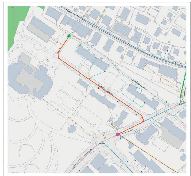
Fig. 10: Tracciato del flusso tra due pozzetti. Abb. 10: Fließstrecke zwischen zwei Schächten. Fig. 10: Tracé du flux entre deux chambres.