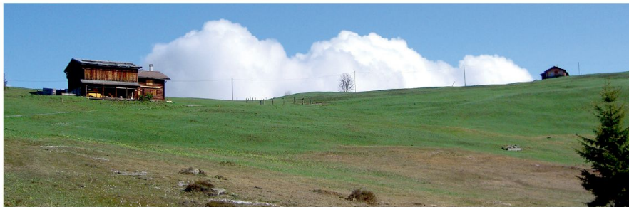
Abb. 6: Impression Stelserberg.

wieder einzustauen. Die Versuche scheiterten am Widerstand einzelner Grundeigentümer. Erfolgreich waren die Bemühungen erst, als das Güterstrassennetz am Stelserberg erneuert werden sollte. Als wichtigste Massnahme sollte der Graben, der den ehemaligen Torfstich entwässert, an zwei Stellen mit Holzspundwänden eingestaut werden. Ein erster Einstauversuch zeigte nur kurzfristigen Erfolg. Nach wenigen Wochen wurden die Spundwände seitlich umflossen. 2013