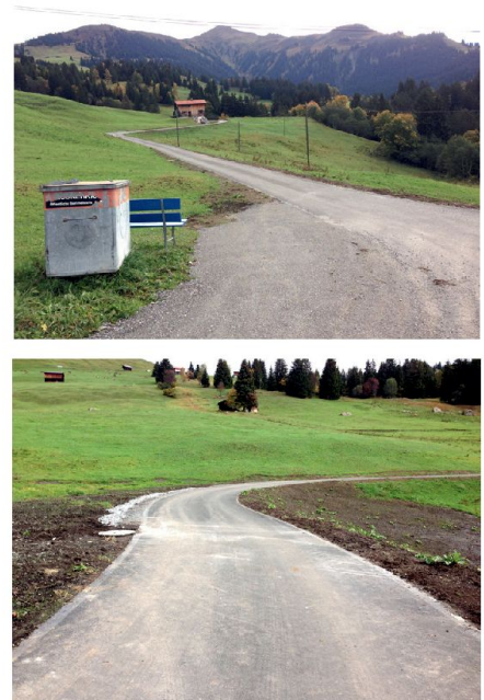
Abb. 4: Weg nach der Erneuerung.

Zeitpunkt waren aber weder ein konkreter Massnahmenplan noch bewilligte Massnahmen vorhanden. Das ALG informierte die zuständigen Gemeindevertreter über die Möglichkeiten der Zusatzbeiträge. Die Gemeinde zeigte sich bereit, Verbesserungsmassnahmen im Moor vorzusehen. Als Basis für die Kostenberechnung und die Baubewilligung sollte durch Spezialistenbüros und dem ANU ein konkreter Massnahmenplan erarbeitet werden. Nach Eingabe der Planung erliessen das ALG und das Bundesamt für Landwirtschaft die Beitragsverfügungen mit Auflagen und Bedingungen. Aufgrund von Artikel 17 Absatz 1 Buchstaben d und f der SVV konnte die Gemeinde vier Prozent an Zusatzbeiträgen für freiwillige ökologische Massnahmen und die Umsetzung überregionaler Ziele auslösen.