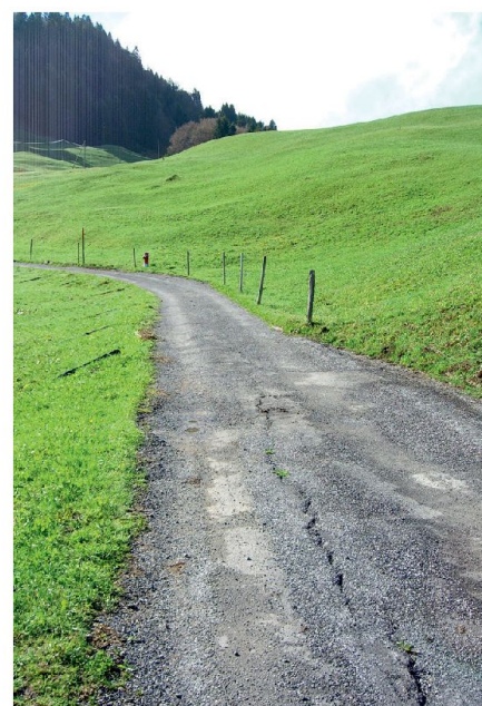
Abb. 3: Weg vor der Erneuerung.