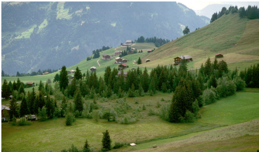
Abb. 1: Stelserberg mit Fulried.

inklusive Moorrevitalisierungsmassnahmen auf 2,3 Millionen Franken. Bund und Kanton anerkannten 1,9 Millionen Franken als beitragsberechtig.