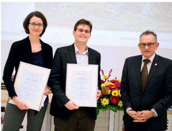
Preisübergabe 23. November 2013.

Ein anderes Fazit dieser Studie: Für Ingenieurberufe interessieren sich fast nur Männer – Frauen sind gesucht! Gerade in unserer Branche wäre weibliche Ingenieurdenkweise dringend notwendig. Daher eine spezielle Gratulation an alle Damen dieser Studiengänge zum erfolgreichen Abschluss. Die Berufsverbände – von denen ich einen hier vertreten