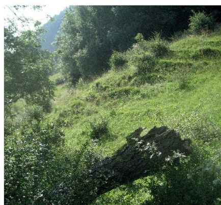
Abb. 4: Ökologische Ersatzfläche mit Pflegedefizit (Massnahme B2).

Auf einer vom Sturm Vivian zerstörten Fläche von 10 ha Fläche werden Weiss-