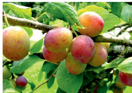
Abb. 5: Schaffung von Obstgärten, Bofelguet (Massnahme B4).