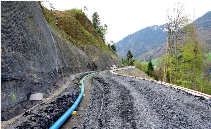
Abb. 2: Bau der Taminabrücke 2013-2017, inklusive Verbindungsstrasse.

gilt sie rechtlich als Wald und dient der Waldbewirtschaftung. Anfang und Ende werden mittels Barriere gesperrt und das Strassentrassée wird reduziert.