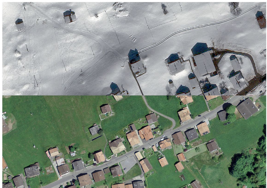
Abb. 1: Bildbeispiel WV03: Orthorektifizierte Winteraufnahme (GSD 30 cm) in der Region Interlaken. Zum Vergleich: SWISSIMAGE (unten).

DigitalGlobe verfügt mit WorldView (WV)-01, WV02, WV03 und GeoEye-01 über eine Anzahl sehr leistungsfähiger Satelliten. Das Flaggschiff dieser Konstellation ist der 2014 in Orbit genommene Satellit WV03. Im Nadir kann dieser mit einer geometrischen Auflösung von bis zu 31 cm aufnehmen (Abb. 1). Airbus betreibt unter anderem die Satelliten Pléiades-1/2 (GSD 50 cm) und SPOT6/7 (GSD 150 cm). Alleinstellungsmerkmal dieses Betreibers ist der vereinfachte Zugang zu den Daten. Über das zugehörige online-Portal können Areas Of Interest (AOIs) definiert, Archivdaten bestellt und Neuaufnahmen programmiert werden.