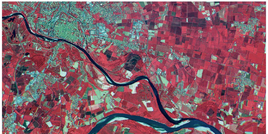
Abb. 2: Eine der ersten Aufnahmen von Sentinel-2 (27. Juni 2015): Falschfarbeninfrarotaufnahme über Pavia (I) mit dem Zusammenfluss der Flüsse Ticino und Po.

Wichtige Beispiele von Anwendungen optischer Daten mittlerer Auflösung liegen im Bereich des langfristigen Monitorings der Atmosphäre (Aerosol- und